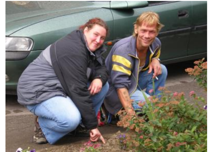
Neue Chancen für integrationsferne Job-Center-Kunden